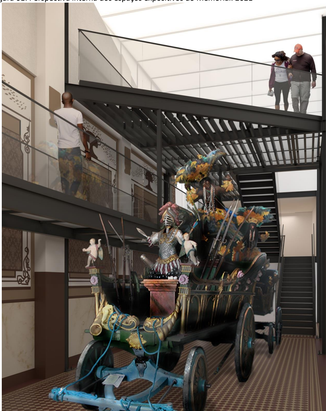
Figura 01: Perspectiva interna dos espaços expositivos do Memorial. 2021

O partido arquitetônico compreenderá a construção de um volume de três pavimentos no fundo do lote, abrigando elevador, sanitários, circulações, área de exposição e sala administrativa, conectado ao espaço do pavilhão existente através estrutura metálica aproveitando o amplo pé-direito existente e explicitando as diferenças entre a construção antiga e a nova.